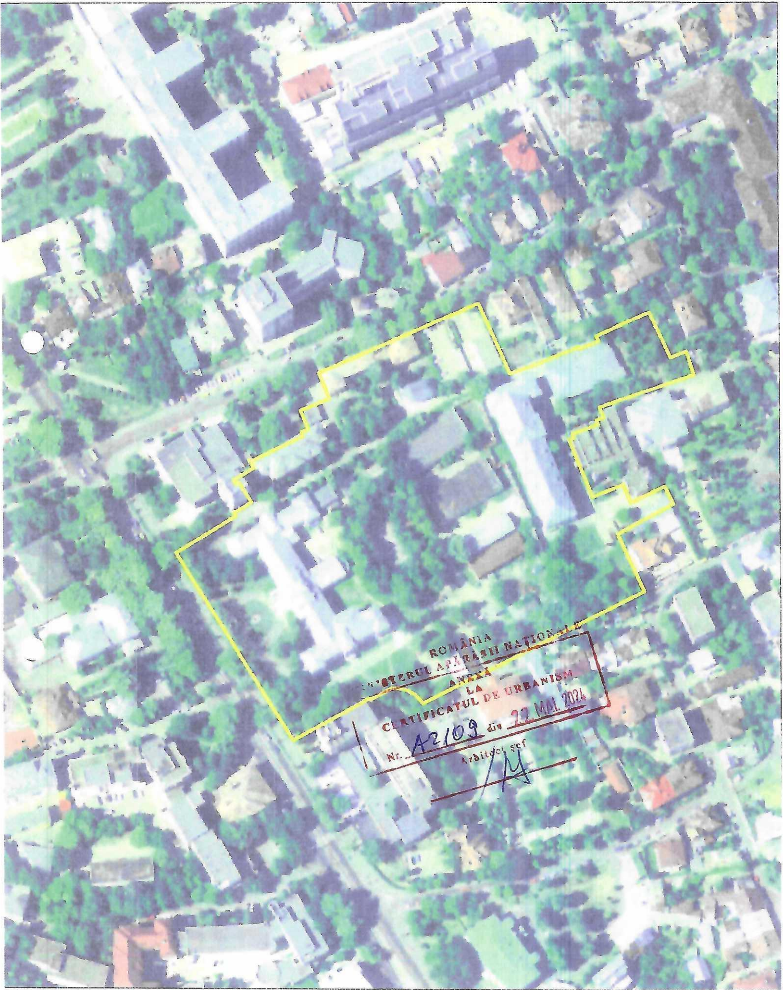
□ - limita imobil 756 Iasi -Spital Militar Iasi